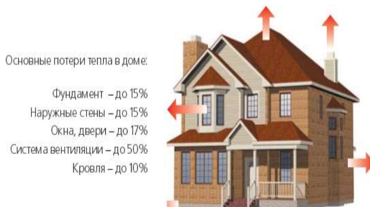
Рис. 1. Основные источники теплопотерь здания

Обеспечения воздухообмена. В современном жилищном строительстве системы вентиляции с естественной тягой и системы с принудительной вытяжной вентиляцией в жилых зданиях приводят к большим потерям тепловой энергии в отопительный период и не пригодны для энергоэффективных зданий. В таблице 1 представлен анализ систем вентиляции жилых зданий